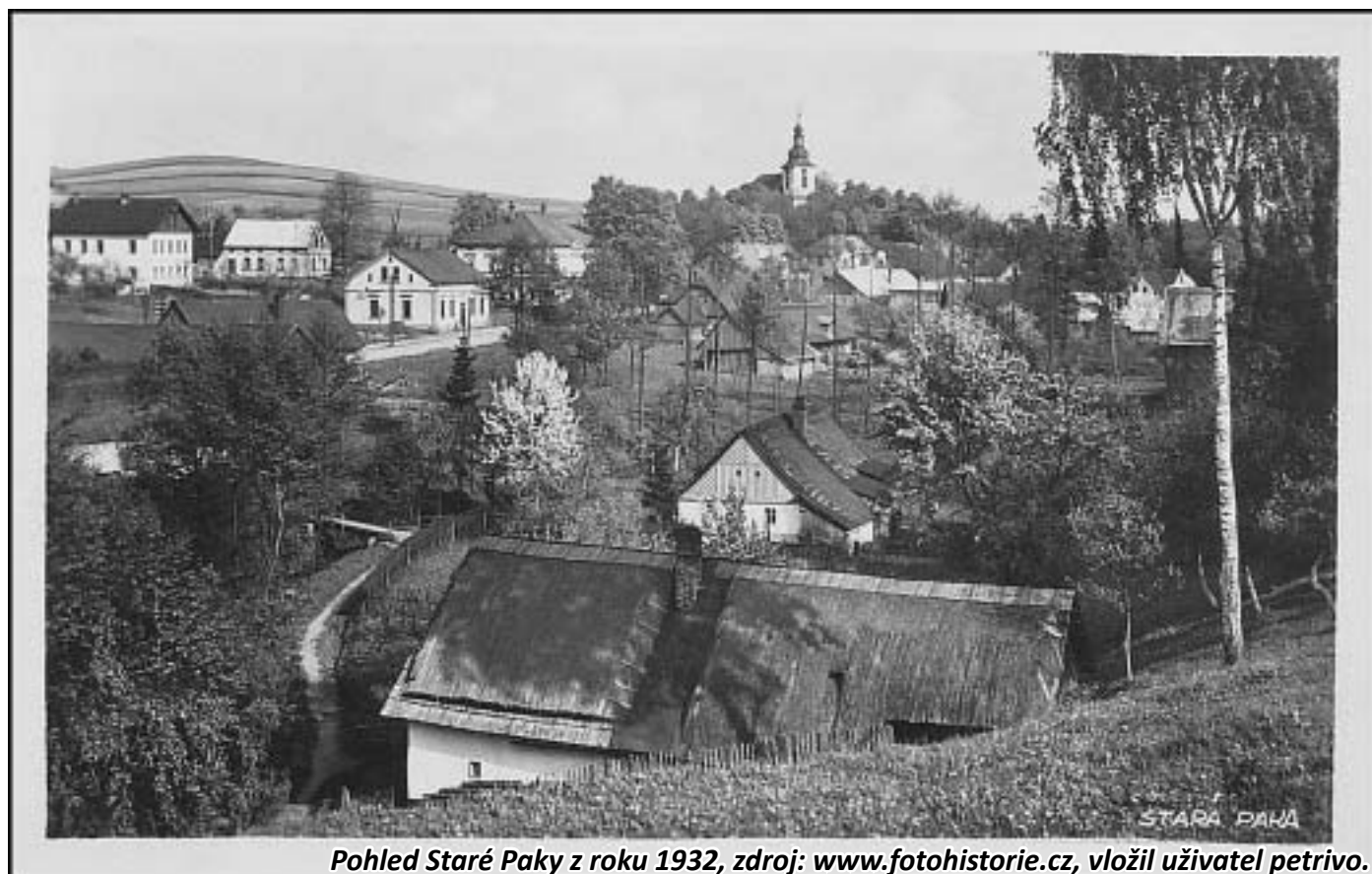
Pohled Staré Paky z roku 1932, zdroj: www.fotohistorie.cz , vložil uživatel petrivo.