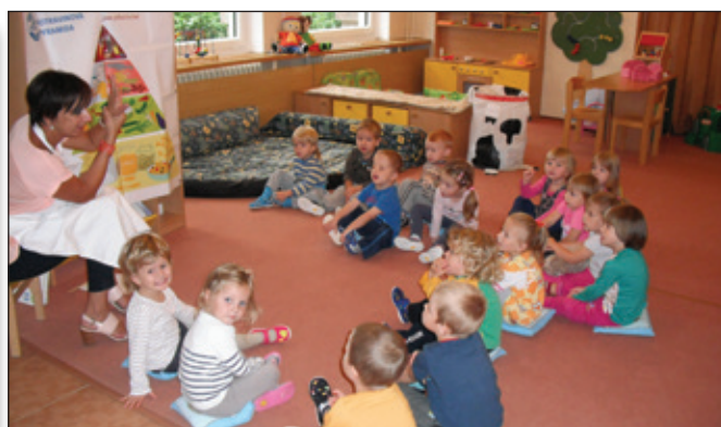
Zdravá strava v MŠ