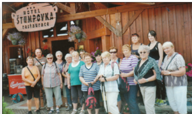
Senioři před hotelem