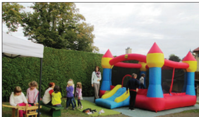
Děti v MŠ