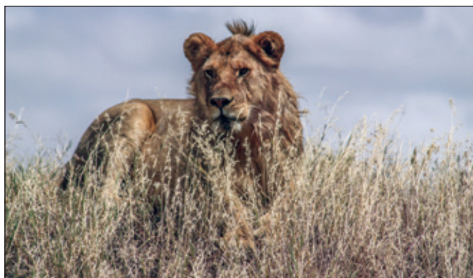
MUDr. Vratislav Čermák zachytil objektivem opravdového krasavce