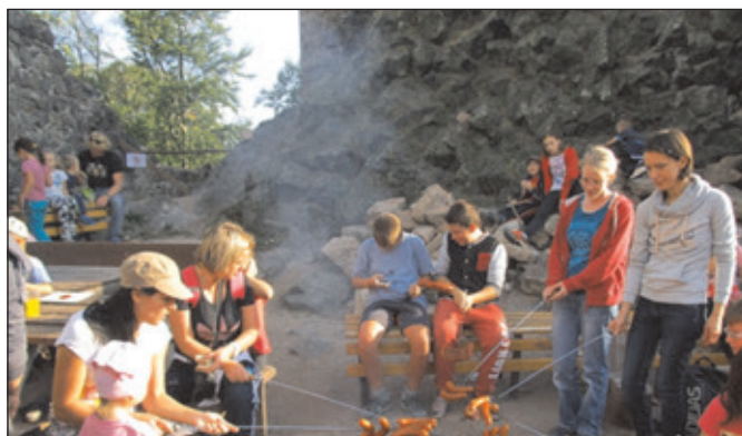
Tradiční pochod s rodiči