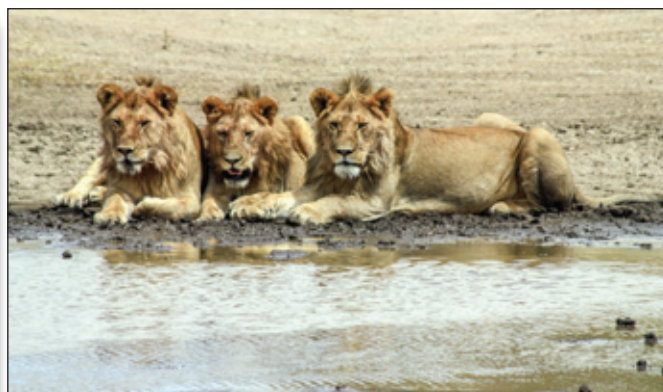
Tři bratři u napajedla