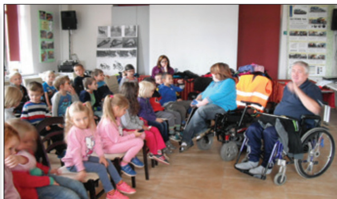
Návštěva v o.s. Život bez bariér