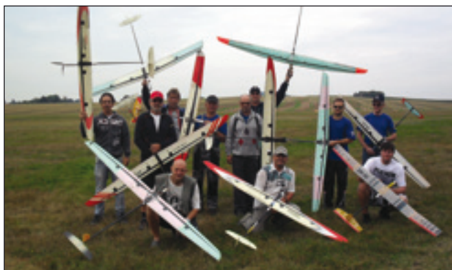
Soustředění modelářů na letišti Stará Paka - Brdo