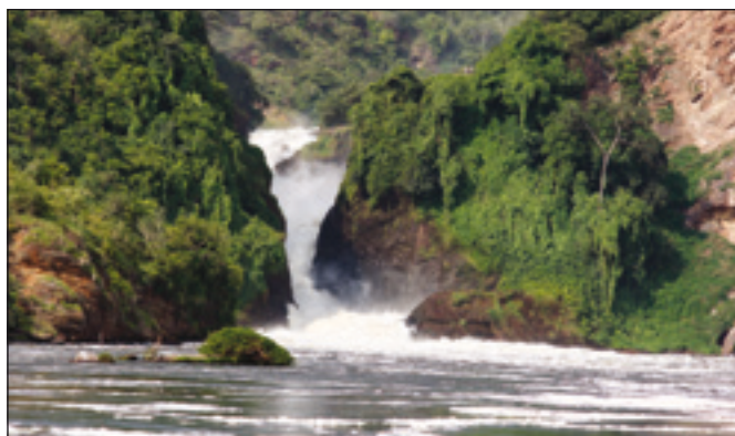
Úchvatná africká příroda