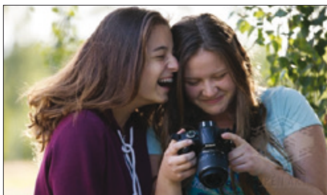
Letní dílny pro děti a mládež Roškopov letos popatnácté!