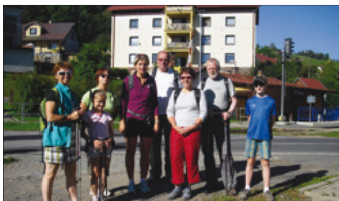
Vejšlap 2016 se podařil a všichni turisté byli spokojeni.