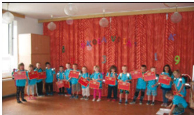
Rozloučení s předškoláky