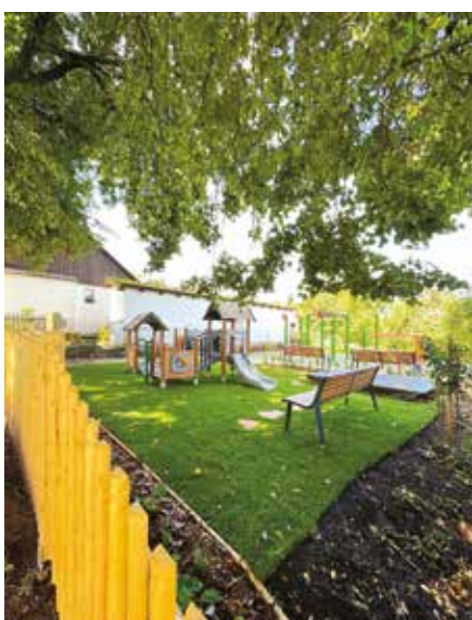
rekonstrukce hřiště Brdo