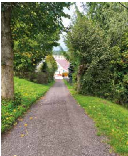
oprava cesty ke Katolickému hřbitovu