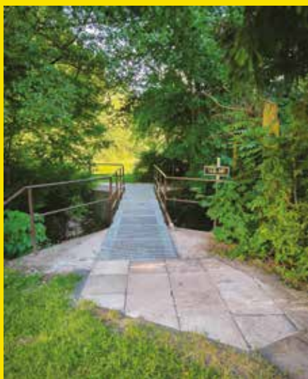
oprava lávky u č. p. 520, Stará Paka