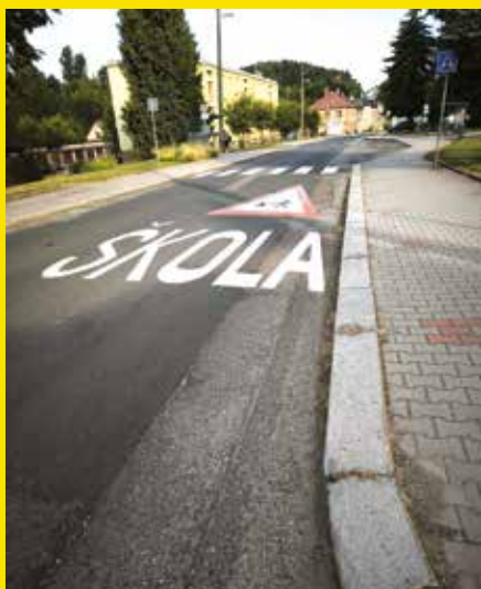
oprava dopravního značení