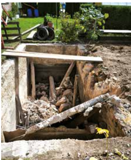
likvidace septiku u č. p. 183, Stará Paka