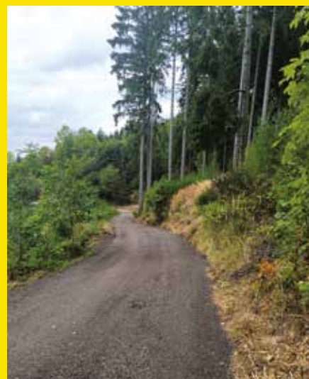
oprava cesty Staropacká hora

PODHORAN - čtvrtletník OÚ Stará Paka. Redakce – Hana Hylmarová, Mgr. Jitka Krausová a Jan Herber. Redakční uzávěrka: 29. 9. 2025. Vychází 4x ročně. Náklad: 400 ks. Adresa redakce: Podhoran, OÚ Stará Paka. Tisk: JOMA design - Příspěvky zasílejte na knihovna@starapaka.cz.