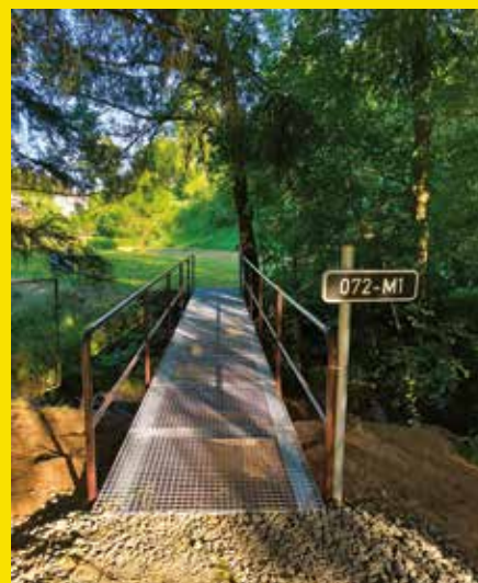
oprava lávky Roškopov