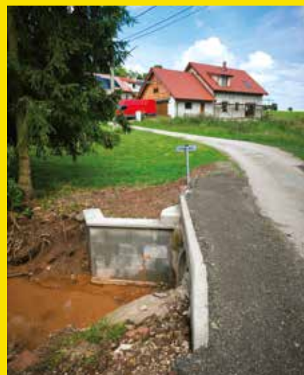
oprava propustku Zápříčnice