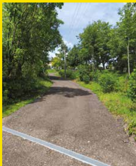
oprava cesty Brdo