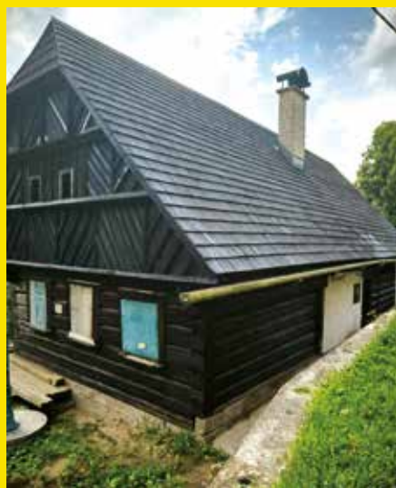
nátěry vnějších ploch Krsmol č.p. 9